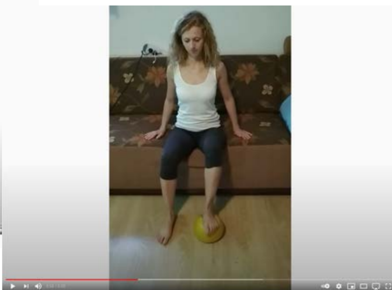
Cvičení dolních končetin