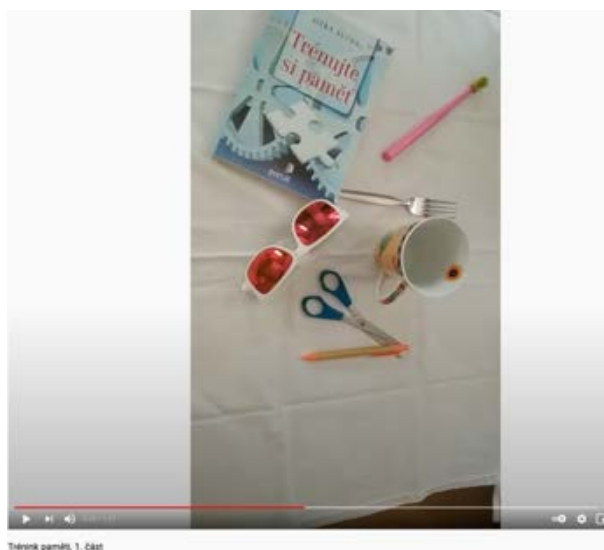
Trenink paměti, 1. část

Podpora ze státního rozpočtu: 117.816 Kč